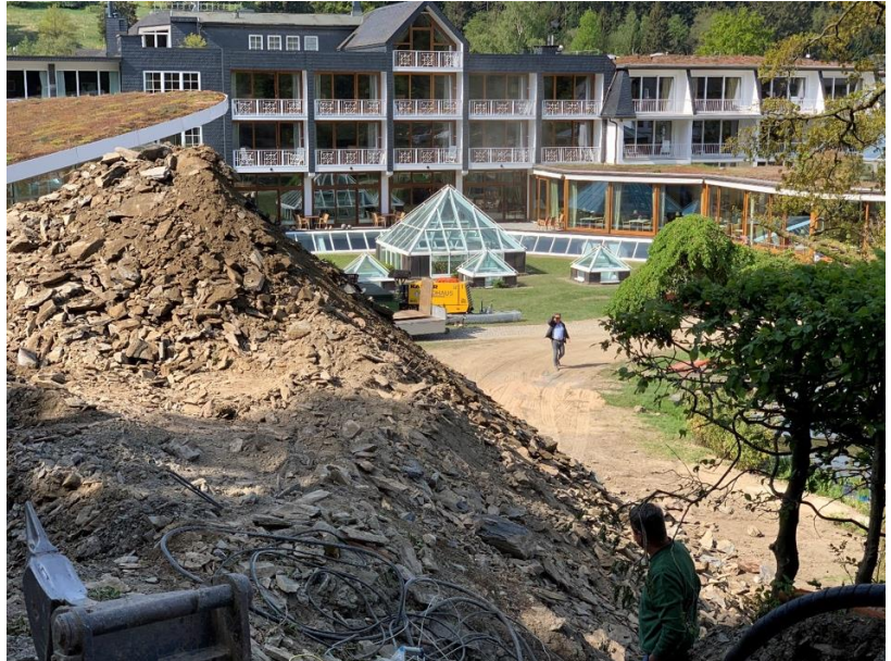
Ausschachtungsarbeiten für die neuen Seeterrassen neben dem Schwimmbad.